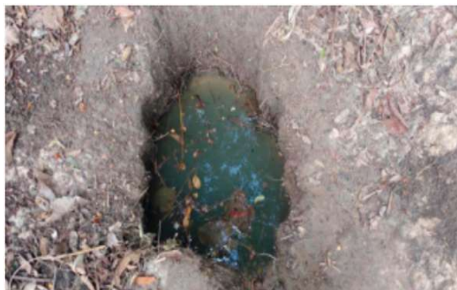
Figura 3. Poço cavado por moradores na ocupação Vitória. Extraído da referência 5.

Os impactos na saúde são uma das manifestações mais cruéis dessa exclusão. A correlação entre a precariedade do saneamento e a alta incidência de doenças infecciosas e parasitárias, como diarreias, giardíase e arboviroses, é uma constante em estudos epidemiológicos em áreas vulneráveis. A intermitência no fornecimento de água e a necessidade de armazenamento em condições inadequadas criam ambientes propícios para a proliferação de vetores, transformando a ausência de saneamento em um catalisador de crises de saúde pública. 14 Essa dinâmica reforça a compreensão de que a saúde não é um atributo individual, mas uma construção social profundamente influenciada pelas condições de vida e pelo acesso a serviços básicos. 15